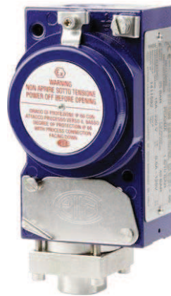
Custodia / enclosure Aluminium mod. PCS2