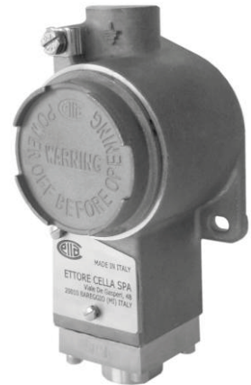
Custodia / enclosure AISI 316L mod. PCS4

Per la terminologia usata in questo prospetto, v. PT-B0-20. CARATTERISTICHE GENERALI DELLA SERIE PCS