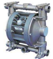
Edelstahl Stainless Steel